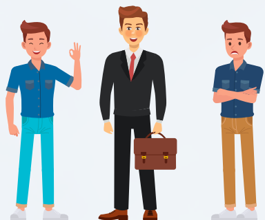
ASEGURADO CONFIANZA COMPRADOR

Asegurado: Es el proveedor de servicios o productos que contrata la póliza.