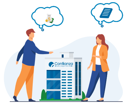
Seguro de Crédito

Otorga mayor control, organización y progreso en los procesos de facturación, es decir, que el Seguro de Crédito garantiza el pago del valor adeudado si un cliente no cancela las facturas a crédito.